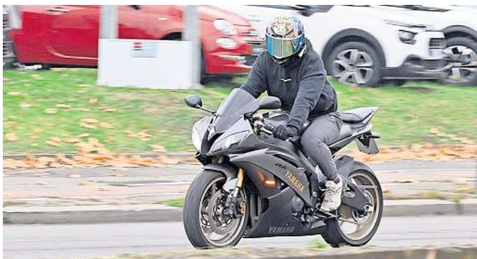
«Der blinkt, der biegt ab»: Das kann, muss aber nicht immer so sein - und kann dann für Irritationen und Unfälle sorgen.

Der Motorradfahrer trägt dem Urteil zufolge aber eine Mitschuld. Er hätte darauf achten müssen, dass der Blinker ausgestellt wird. Deshalb musste er zu einem Drittel für den Unfall haften. (dpa)