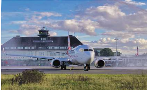
Urlaub ab der ersten Minute: Fliegen ab Braunschweig

Den Katalog, weitere Informationen und Buchungsmöglichkeiten zu diesen exklusiven Angeboten erhalten Sie unter der kostenfreien (aus dem dt. Festnetz) Buchungshotline Tel. 0800 / 38 300 38 (Mo–Fr 9–18 Uhr, Sa 9–13 Uhr), im FIRST Reisebüro Schmidt sowie weiteren Reisebüros oder unter www.fliegen-ab-braunschweig.de