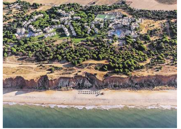
Zahlreiche Hotels auch mit Kinderfestpreis, wie hier das 4* Adriana Beach Club Resort an der Algarve, stehen im Angebot von „Fliegen ab Braunschweig“

Weitere Ziele im Herbst sind Kalabrien, Zakynthos, Zypern, Madeira und Rom. Bereits ab € 699,- kann man ab Braunschweig für 1 Woche inkl. Hotel in den Urlaub starten. In den meisten Zielen gibt es zudem Kinderfestpreise ab € 499,-. Wer sich über die Ziele genauso informieren möchte: Auf www.fliegen-ab-braunschweig.de stehen zu jeder Destination spannende Podcast mit genauen Beschreibungen zum Abruf bereit. Jetzt heißt es: Kommen Sie an Bord und erleben Sie Boutique-Urlaub direkt ab Braunschweig.