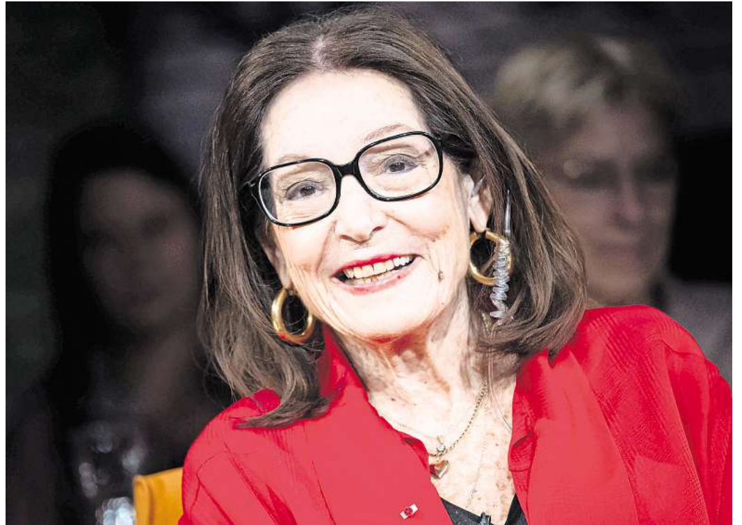
Sängerin Nana Mouskouri.

Zuletzt war Mouskouri auf dem im März erschienenen Gospelalbum von Nina Hagen mit dem gemeinsamen Song „Never Grow Old“ vertreten. (dpa)