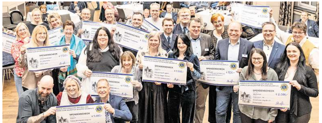
Freude bei den Empfängerinnen und Empfängern: Der Lions Club Salzgitter Schloß Salder übergibt die Spendenschecks aus dem Verkauf der Adventskalender.