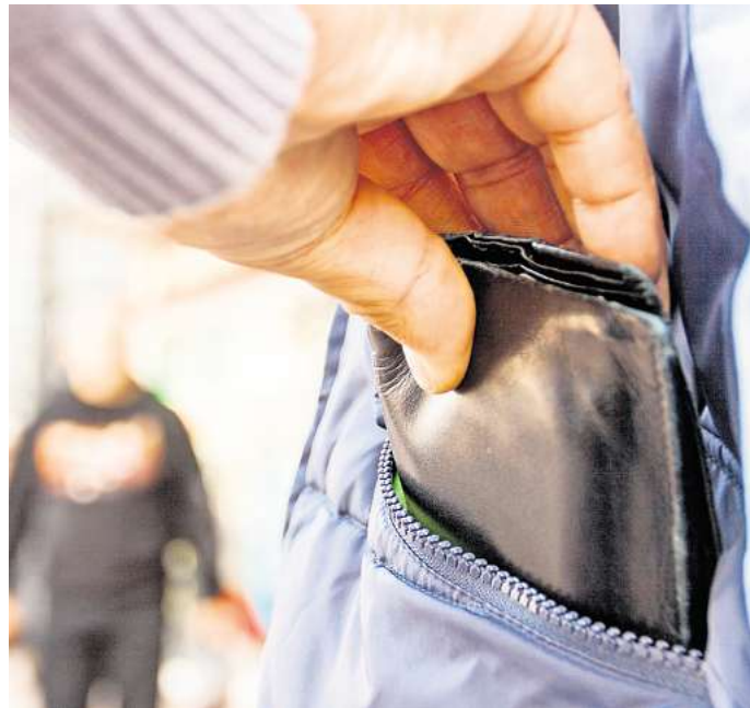
Vorsicht, Langfinger: Die Polizei in Salzgitter hat verstärkt Diebstähle in Einkaufsmärkten festgestellt.

Daher möchte die Polizei laut Sprecher Matthias Pintak „die Bevölkerung sensibilisieren, aufklären und durch gezielte Präventionstipps schützen“. Die Täter agieren demnach häufig durch Ablenkungsmanöver, beispielsweise fragen sie nach dem Weg oder bitten darum ihnen Geld zu wechseln. Dadurch erkennen sie, „wo die Geschädigten ihre Wertsachen verwahren“. Eine andere Masche sei das absichtliche Anrempeln, damit Mittäter gezielt den Diebstahl begehen können. Körper-