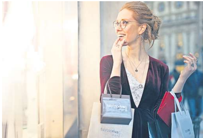
Dinge in Einkaufstüten nach Hause schleppen, die man später doch nicht nutzt oder mag – das passiert fast jedem Menschen mal.

Zum Schluss hat er noch zwei gute Nachrichten: Ein Stück weit sei der Mensch lernfähig, was sein Konsumverhalten angehe. Wer zu Impulskäufen neige, solle öfter mal durch die Innenstadt flanieren und nichts kaufen. Und: Je älter wir werden, desto weniger Fehlkäufe landen in den Schränken: „Ältere Konsumenten sind in der Regel die vernünftigeren Konsumenten.“