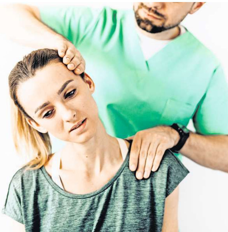
Die Anhebung der Vergütung für physiotherapeutische Leistungen hat zu einem regelrechten Niederlassungsboom in diesem Bereich geführt.

wie vor aber große regionale Unterschiede zwischen den einzelnen Bundesländern. Während in Sachsen im Jahr 2021 bereits eine Praxis pro 1326 Versicherte ihre Leistungen anbot, lag dieser Wert in den Ländern Nordrhein-Westfalen, Bremen und Hamburg mit etwa 2300 Versicherten je Praxis noch deutlich höher.