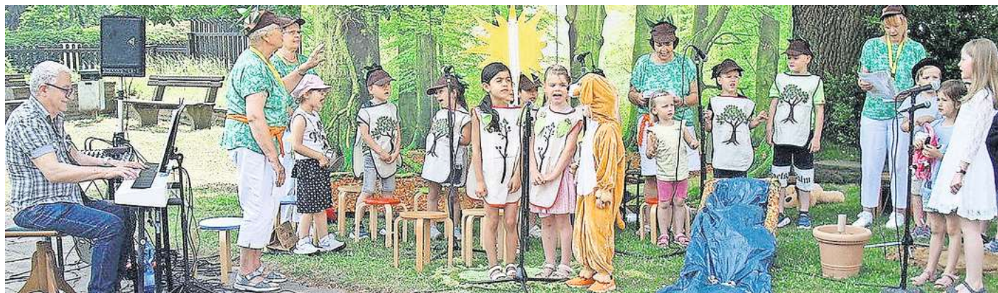
Ein musikalisches Waldmärchen: Auftritt der Kinder beim Tag des Singens 2022 in Salder.