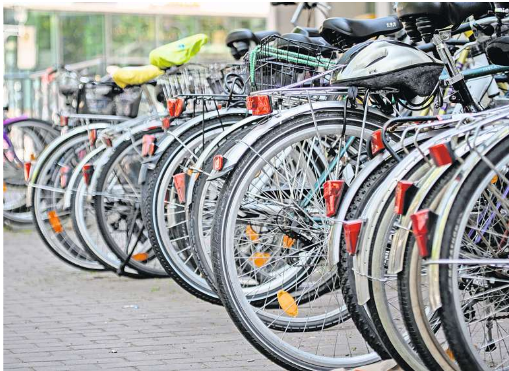
An vielen Hauptbahnhöfen sind Fahrradstellplätze rar.

Grünen kritisierten, es gebe keinen großen Gesamtplan. „Bei den Radwegen an Bundesstraßen kann exekutiv wie auch rechtlich einiges an Planungsbeschleunigung erreicht werden. Aktuell kämpft die FDP allerdings nur für Autobahnen“, so der grüne Verkehrspolitiker Stefan Gelbhaar in der „Süddeutschen Zeitung“. Auch der ADFC forderte eine Planungsbeschleunigung für Radinfrastrukturprojekte.