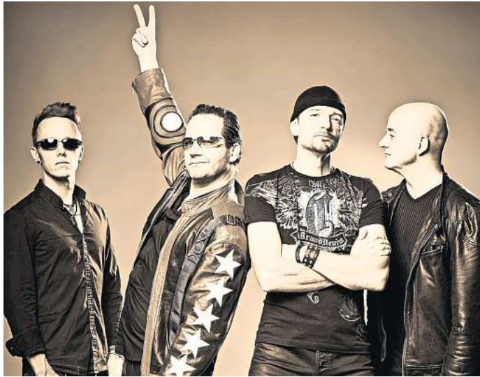
Versprechen eine U2-Show: Die Tribute-Band „Achtung Baby“ gastiert am 15. April in Lebenstedt.

„Achtung Baby“ präsentiert eine Tribute Show in der Kulturscheune