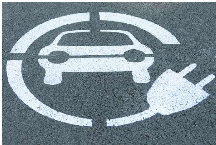
Die Versorgung mit Fahrstrom ist entscheidend für die Attraktivität von E-Fahrzeugen.

leistung zur Verfügung stehen – allerdings bis 2028 nur an der Hälfte der Hauptverkehrsstraßen der EU. De Vries spricht von einer „Infrastrukturücke“, weil Ausnahmeregelungen eine Abdeckung der Routen erschweren und 2030 mindestens 50 000 Ladegeräte allein für schwere Lkw in der EU benötigt würden. Eine kurzfristige Überprüfung der Vorgaben für Lkw sei notwendig.