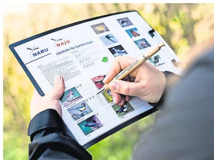
Mitmachen ist ganz einfach: Der NABU in Salzgitter bietet Zählhilfen an für die "Stunde der Gartenvögel".

Sorgen macht den Ornithologen der Feldsperling. Die Spatzenart steht auf der Vorwarnliste der Roten Liste, auch in Niedersachsen, und wird bei der „Stunde der Gartenvögel“ immer seltener gezählt. Er steht in Konkurrenz zum kräftigeren Haussperling, darum ist er häufiger im ländlichen Siedlungsraum anzutreffen. Dort ist der Feldsperling durch die intensive Landnutzung bedroht, weil er kaum noch Nahrung wie Samen und Insekten sowie Nistplätze findet. Im vergangenen Jahr belegte der Feldsperling in Südost-Niedersachsen Platz neun, während der Haussperling, gefolgt von Star und Amsel, den ersten Platz belegte.