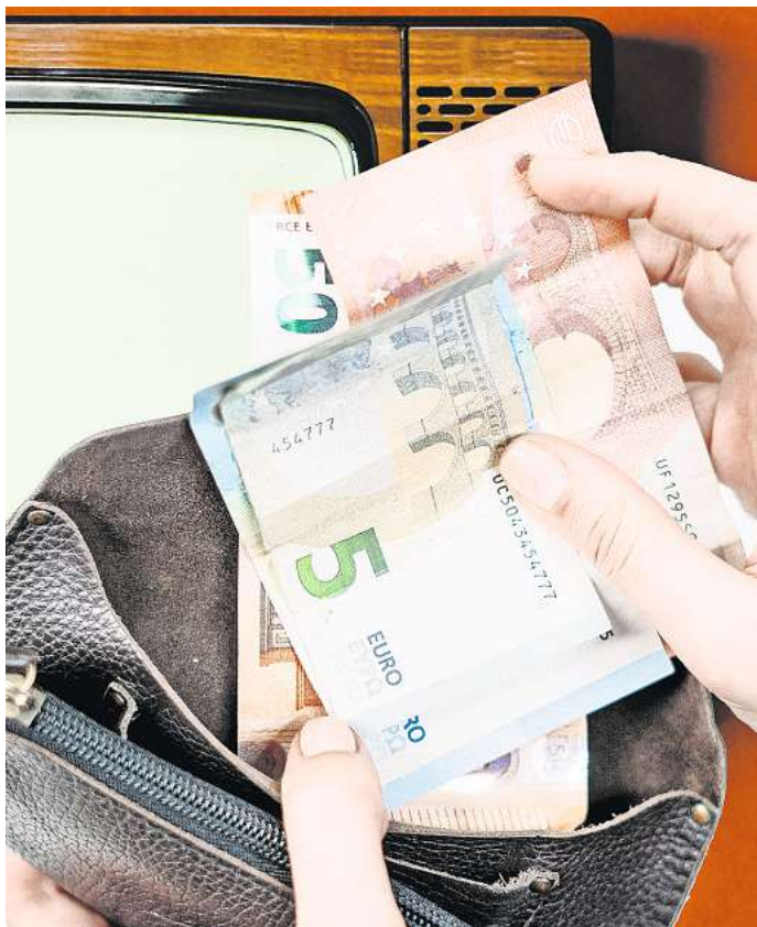
Wollen mehr Geld: ARD, ZDF und Deutschlandradio hatten Ende April ihren Finanzbedarf für die Jahre 2025 bis 2028 bei der unabhängigen Kommission KEF angemeldet. COLLAGE: NIEHAUS

Rundfunkbeitrag in einer Form, die von den Menschen nicht mehr hingenommen wird.“ Die AfD forderte, den öffentlich-rechtlichen Rundfunk finanziell stark zu beschneiden und künftig auf den Grundauftrag zu beschränken. Die Grünen sehen auch Reformbedarf, wollen aber keine Programmreduzierung.