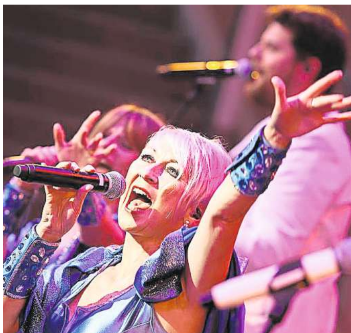
Eine Reise in die bunte Welt der 70er Jahre: Die Band ABBA-Fever tritt am 10. Juni beim Zeltival auf.

ABBA Fever übernimmt am 10. Juni um 20 Uhr das Zelt. Die Gruppe trat vor mehr als 20 Jahren das Erbe der schwedischen Popgiganten an - mit großem Erfolg! Im In- und Ausland entwickelten sich der Auftritt der sieben Hamburger zur absoluten Nr. 1 der Abba Tribute Shows. Angekündigt wird eine Reise in