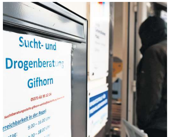
Die Sucht- und Drogenberatung zieht in das ehemalige Speicherhof-Café.

Unter dem Dach von Venito startete die Sucht- und Drogenberatung zu Jahresbeginn mit neuer Anlaufstelle zunächst in den Räumen im Mehrgenerationenhaus im Georgshof. Gleichzeitig begann aber auch die Suche nach einem Standort in Innenstadtnähe – und diese war nun erfolgreich. „Die Nähe zum Mehrgenerationenhaus ist natürlich super. So können wir Synergien nutzen“, freut sich Schulte. Über den genauen Zeitpunkt zum Umzug und die Eröffnung am neuen Standort werde die Dachstiftung rechtzeitig informieren.