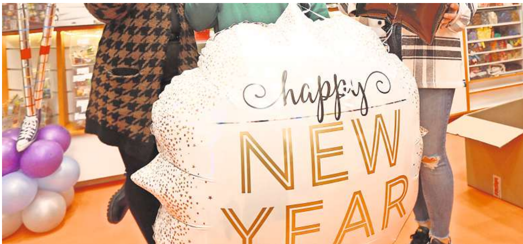
Gehen Sie mit guten Vorsätzen in das Jahr 2024?

Doch bei den meisten Menschen bleiben die guten Vorsätze