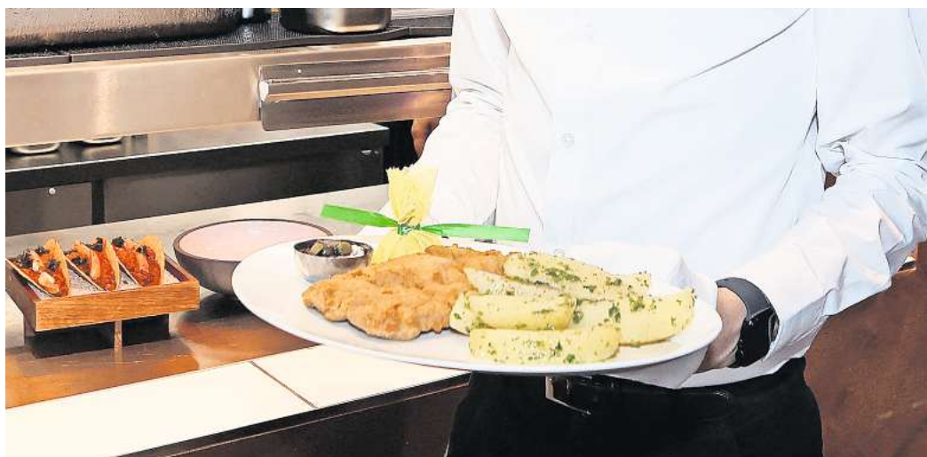
Mehrwertsteuersatz wieder bei 19 Prozent: Das Schnitzel wird in vielen Restaurants teurer.

Bleiben nun die Gäste aus, so wie es der Branchenverband befürchtet? Knausern die Restaurantbesucher beim Trinkgeld? Wir würden gerne von Ihnen wissen, ob Sie bei steigenden