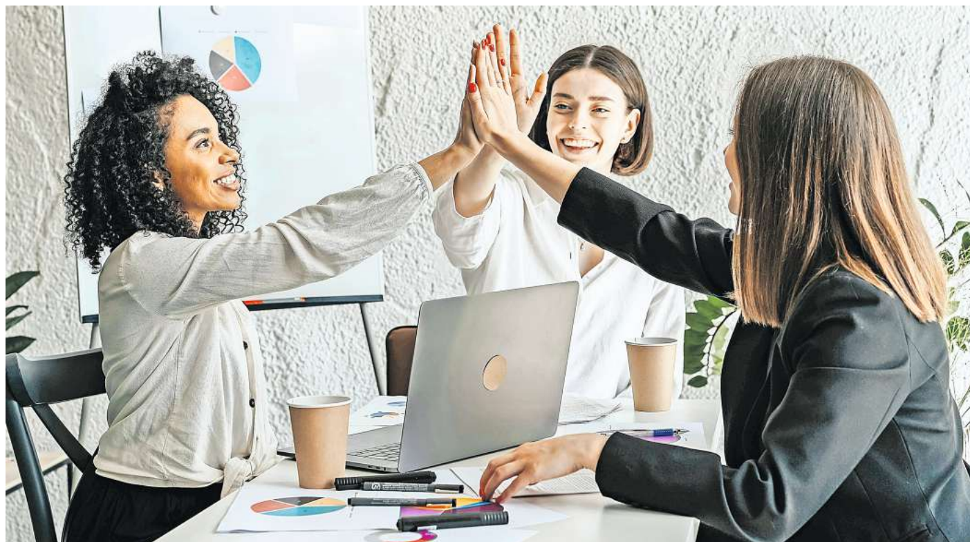
45 Unternehmen und Organisationen testen die Vier-Tage-Woche für ein halbes Jahr.

Initiator des Projekts ist die Unternehmensberatung Intra-