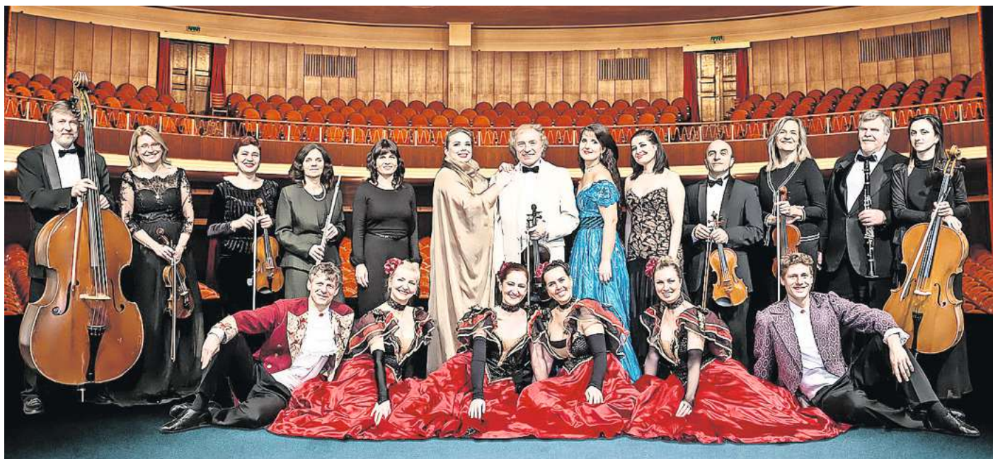
Hochrangige Künstler des Nationaltheaters Brunn, des Prager Fernsehballetts und namhafte Vokalistinnen präsentieren dem Publikum in der Gifhorner Stadthalle „Traummelodien der Operette“.

In diesem glanzvollen Operetten-Programm entzünden die Musiker vom Nationaltheater Brunn ein musikalisches Feuerwerk: Von Jacques Offenbach und Karl Millöcker über Carl Zeller und Franz von Suppé bis hin zu Vater und Sohn Strauß sind alle Komponisten der „Goldenen Ära der Operette“ in dieser Revue vertreten. Die Sopranistinnen sind allesamt gefeierte Stars an renommierten Häusern, beispielsweise in Stockholm, Wien und Lyon. Und das Ballettensemble, das sich aus hervorragenden