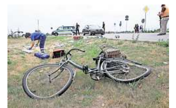
Schwere Unfälle mit Radfahrenden: Polizei und Verkehrswacht raten zum Tragen eines Helms und Fahrsicherheitstrainings.

Ein Training sei deshalb eine gute Möglichkeit, sich mit dem Pedelec vertraut zu machen und eine entsprechende Sicherheit im Umgang damit zu bekommen, wirbt Dietrich. Übrigens gelte beim Kursus Helmpflicht. Auch Dietrich rät dringend zum Schutz des Kopfs – auch angesichts dessen, dass es immer mehr SUVs gebe, die wegen ihrer schieren Größe das Aufprallrisiko verschärfen.