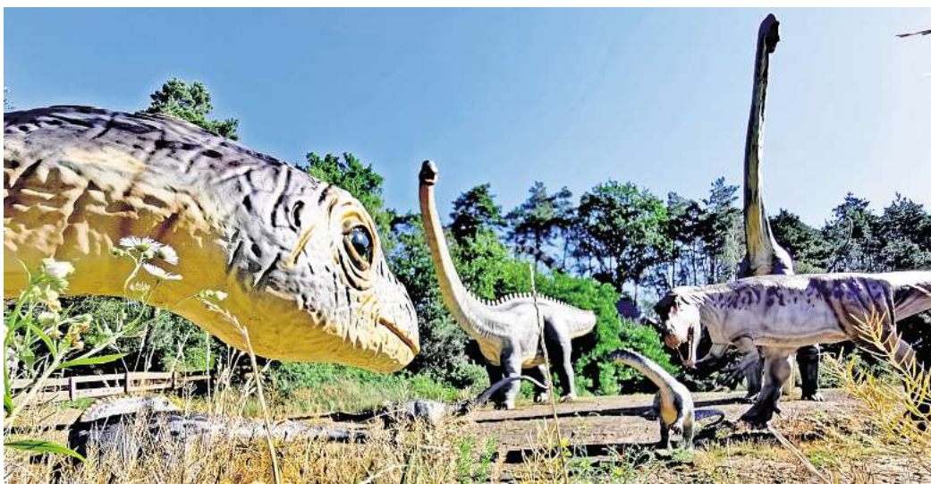
Auch für den Dinopark Münchenhagen gibt es Eintrittskarten zu gewinnen: Lebensgroße Rekonstruktionen von Dinosauriern und anderen Urzeittieren sind dort zu sehen.