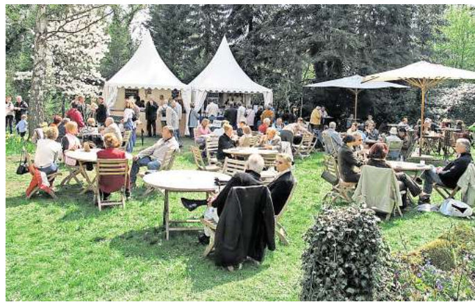
„Gourmet & Garden“ findet am Landgut Wienhausen statt: Die AZ verschenkt zehnmal zwei Tickets für die Ausstellung.

Geöffnet ist die Schau von Donnerstag bis Samstag jeweils von 10 bis 18 Uhr, am Sonntag