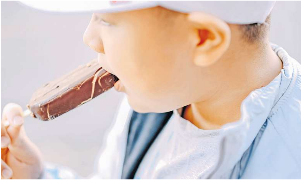
Kinder und Jugendliche sind für die Lebensmittelindustrie als Werbezielgruppe äußerst interessant.

An Kinder gerichtete Lebensmittelwerbung bewirkt fast ausschließlich ungesunde Produkte, sagt Expertin Molling. Der Grund seien die hohen Gewinnmargen bei Snacks, zuckrigen Limonaden und Frühstücksflocken. Dabei wüssten die Konzer-