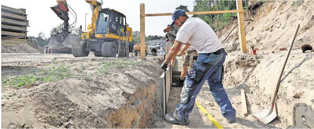
Es geht voran: Das Klimaschutzquartier Hohe Düne soll noch in diesem Jahr den nächsten großen Schritt vollziehen - dann beginnt der Bau des Kita-Komplexes inklusive gefördertem Wohnungsbau.

Ansonsten ist die Zeit der Genehmigungsverfahren. Noch sei der