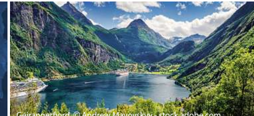
Geirangerfjord, © Andrew Mayovsky - stock.adobe.com