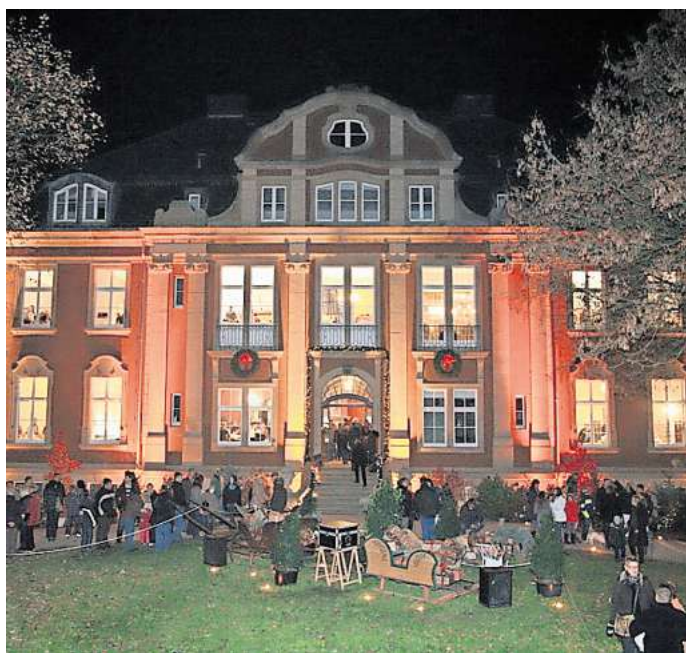
Die AZ verlost Karten für die Winter-Träume auf Schloss Eldingen.

Wer die Chance auf eine Freikarte verpasst, der zahlt an der Tageskasse 15 Euro. Kinder bis 12 Jahre haben freien Eintritt, Schüler, Stu-