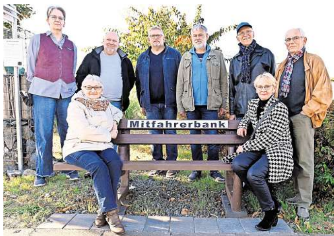
Alternative zum Bus: Die Gemeinde Osloß hat in Osloß und Weyhausen je eine Mitfahrerbank aufgestellt.

Vorschlägen will Schlichting es dem Gremium aber, zumal sich die Kosten leicht über Fördergeld aus dem Bundesprogramm „Zukunftsfähige Innenstädte und Zentren“ decken ließen, aus dem Fallersleben derzeit jährlich bis zu 60.000 Euro abrufen kann.