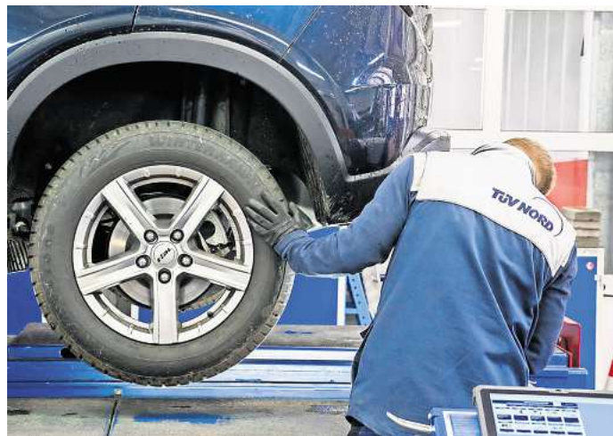
Ein Sachverständiger vom Tuv Nord überprüft bei einer Hauptuntersuchung (HU) einen PKW.