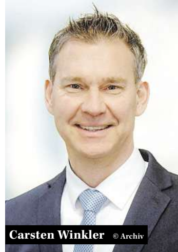
Carsten Winkler © Archiv