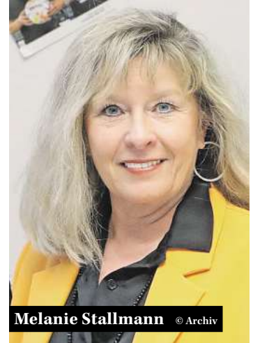
Melanie Stallmann © Archiv