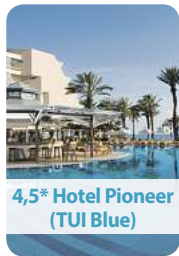
4,5* Hotel Pioneer (TUI Blue)

Auf der drittgrößten Mittelmeerinsel im Süden Europas herrschen nicht nur außergewöhnlich gute Temperaturen, auch die Lebensfreude und einzigartige Kultur sind hier zu Hause.