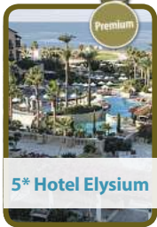
5* Hotel Elysium