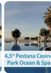
4,5* Pestana Casino Park Ocean & Spa