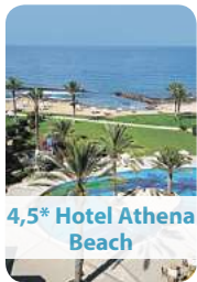
4,5* Hotel Athena Beach