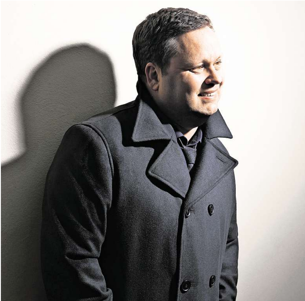
Weltstar Paul Potts kommt nach Gifhorn.