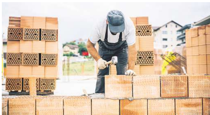
Aufgeflogen: Bei einer landesweiten Schwarzarbeit-Kontrolle fiel ein Bauherr bei Wesendorf auf, weil er vor der offiziellen Genehmigung bereits losgelegt hatte.

Im Bereich Braunschweig waren insgesamt 37 Bediens-tete der Kommunen, 36 Be-dienstete der Finanzkontrolle Schwarzarbeit sowie zwölf Bedienstete der Berufsgenos-senschaft der Bauwirtschaft, der Berufsgenossenschaft für Energie, Textil, Elektro und