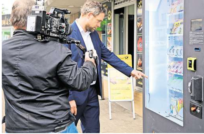
In Gifhorn kam der Stein ins Rollen: Das Verbot von Lachgas als Partydroge hat die neue Bundesgesundheitsministerin Nina Warken als ihr erstes Gesetz angekündigt.

Im Dezember konnte der Kreistag diese Gefahrenabwehrverordnung beschließen, die zum 1. Januar dieses Jahres in