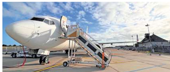
Fliegen ab Braunschweig – exklusiv mit momento by DER SCHMIDT

der kostenfreien Buchungshotline T. 08 00 / 38 300 38 (Mo.-Fr. 9 – 18, Sa. 9 – 13 Uhr), im FIRST REISEBÜRO SCHMIDT und weiteren Reisebüros der Region oder unter www.fliegen-ab-braunschweig.de .