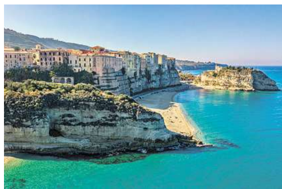
Direkt von Braunschweig an Italiens Stiefelspitze. Das traumhafte Tropea in Kalabrien.

In allen Zielen hat man die Auswahl aus einem großen und vielfältigen Hotelangebot. Egal ob Best-Preis oder Premium, Clubanlage oder Top-Lage. Von Frühstück bis All Inclusive. Bereits ab € 699,- inkl. Hotel und Transfer kann man ab Braunschweig starten. Ausflüge und weitere Leistungen sind zusätzlich buchbar. So ist vom