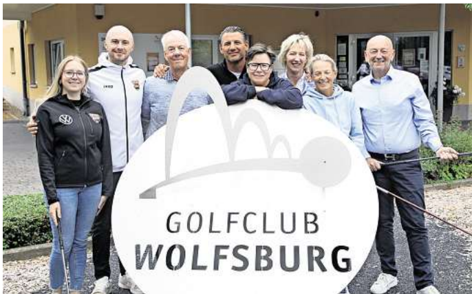
AZ/WAZ-Leser haben die Chance, gemeinsam mit den Spielern der Grizzlys zu golfen.