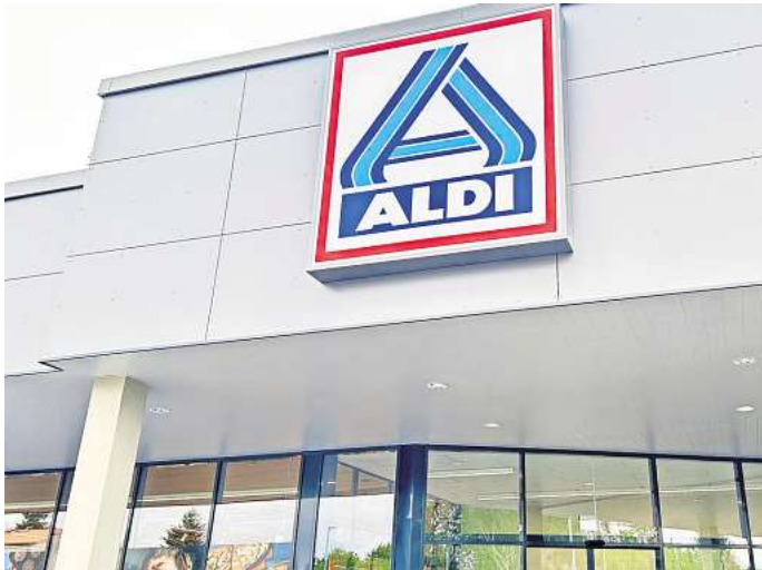
Nach dem Brand an der Adam-Riese-Straße in Gifhorn: So ähnlich könnte der neue größere Aldi aussehen.

Änderung des Bebauungsplans „Innenstadt Teil II Süd“ notwendig.