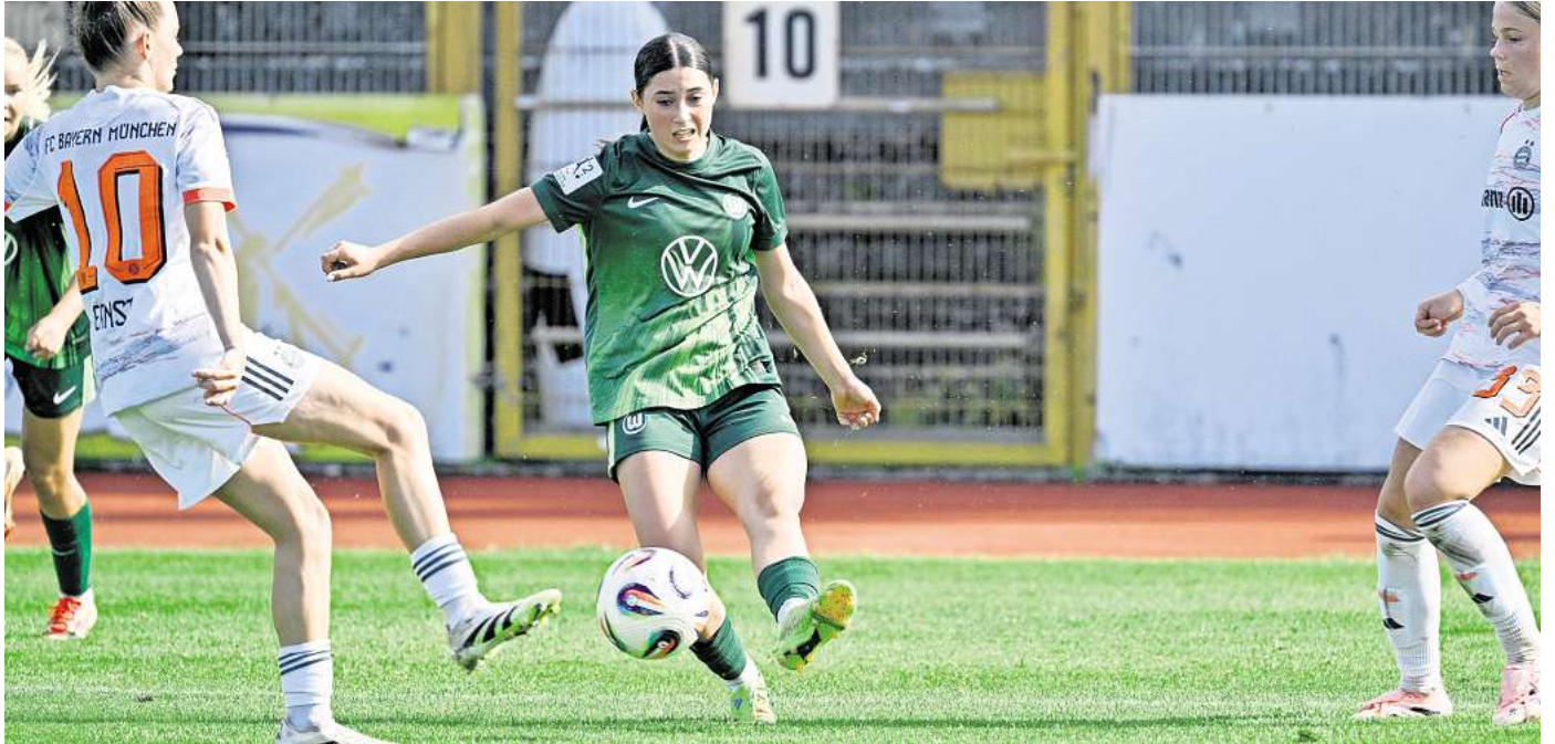
Der VfL Wolfsburg will weitere Punkte sammeln

Für die Partie des VfL Wolfsburg gegen den SV Werder Bremen können Sie 2x2 VIP-Karten gewinnen.