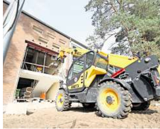
Wird zur Interims-Grundschule: Im ehemaligen BGS-Areal am Wilscher Weg laufen die Bauarbeiten an einem Gebäude-trakt.

Die Interimsschule soll später in die jetzige Freiherr-vom-Stein-Schule ziehen. Diese wird bis dahin Ausweichquartier nacheinander für Albert-Schweitzer-Schule und Gebrüder-Grimm-Schule sein, wenn die Stadt deren Standorte auf Vordermann bringt. Danach folgt die Kernsanierung der Stein-Schule selbst, nach der die Interims-Grundschule dann endgültig dort einziehen soll.