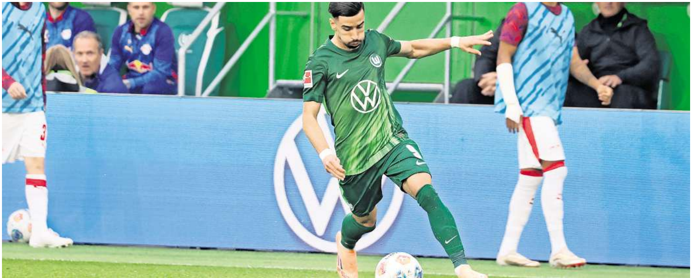
Gewinnen Sie Karten für das nächste Heimspiel gegen VfB Stuttgart

Nach dem Unentschieden gegen den 1. FSV Mainz 05 und dem 1. FC Köln folgte im dritten Heimspiel eine knappe 0:1-Niederlage gegen RB Leipzig. Und auch der Gegner im vierten Heimspiel hat es in sich. Der VfB Stuttgart steht aktuell auf Platz vier der Tabelle.