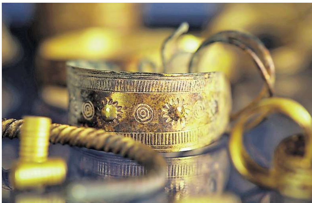
Der Gesseler Goldhort ist einer der größten mitteleuropäischen Goldfunde der Bronzezeit.

Bei systematischen archäologischen Untersuchungen vor dem Bau der „Nordeuropäischen Erdgasleitung“ wurde 2011 im niedersächsischen Gessel bei Syke einer der umfang-