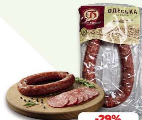
Bogoduh. Wurst Saljami Odesskaja je 100g (1 kg = 7,90*)

bis zu 25% auf Frische & Tiefkühlprodukte