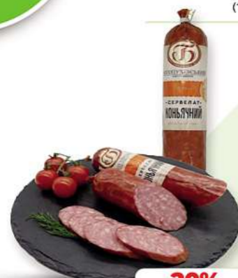
Bogoduh. Wurst Serwelat Konjachnyj je 100g (1 kg = 11,90*)