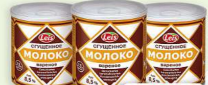
Leis Kondensmilch gezuckert und karamellisiert 8,5% Fett 370g (1 kg = 4,84*)