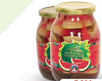
Eingelegte Wassermelonen "Moldavanka" 1062ml (1kg = 2,62*)