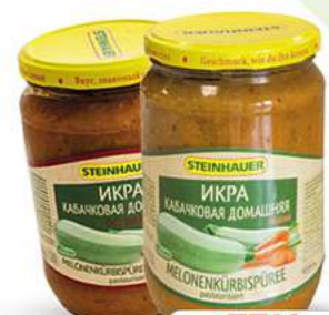
Melonenkürbispüree pasteurisiert, ohne oder mit Papercori 720ml (1kg = 3,88*)