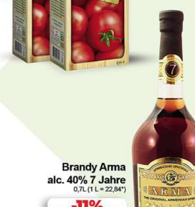
Brandy Arma alc. 40% 7 Jahre 0,7L (1 L = 22,84*)