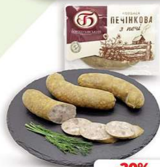
Bogoduh. Wurst Pechonchnaja je 100g (1 kg = 7,90*)