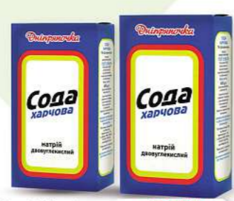
Ukrainisches Backpulver (Soda) Dniprjanochka 400g (1kg = 2,20*)