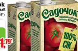
Cagochok 100% CJK