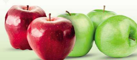
Äpfel RED CHIEF und Granny Smith HKL und Herkunft siehe Etikett je kg