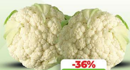
Blumenkohl HKL und Herkunft siehe Etikett je Stück