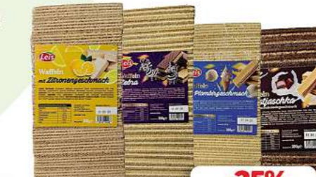
Leis Waffeln verschiedene Sorten 300g (1kg = 4,97*)