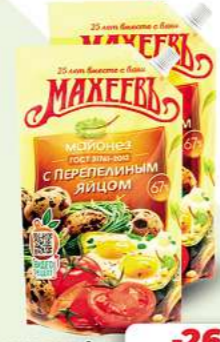
Salatmayonnaise mit Wachteleiern Fett 67% MAHEEV 380g (1kg = 5,24*)