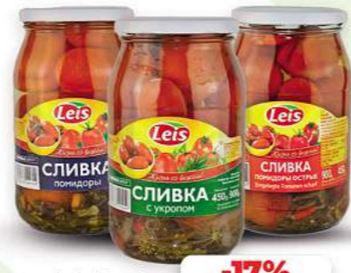
Leis Tomaten Slivka mariniert verschiedene Sorten 880g (1kg = 2,15*)