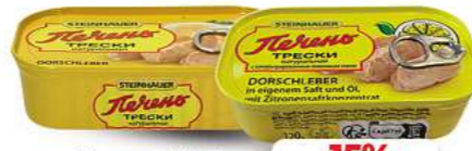
Dorschleber in eigenem Saft und Öl oder in eigenem Saft und Öl, mit Zitrone 120g (1 kg = 18,25*)