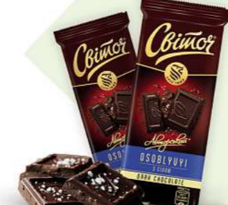
Svitoch Schokotafel Zartbitter mit Salz 85g (1kg = 14,00*)