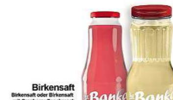
Birkensaft oder Birkensaft mit Cranberry Geschmack 1 L