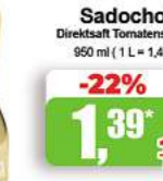
Sadochok Direktsaft Tomatensaft 950 ml (1 L = 1,46*)