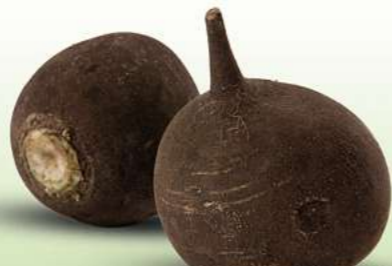
Schwarzer Retich HKL und Herkunft siehe Etikett lose, je kg