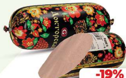
Brühwurst Doktorskaja "Chochloma" 800g (1 kg = 5,44*)