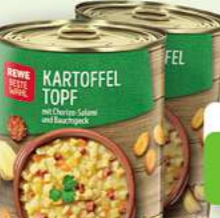
Kartoffeltopf mit Chorizo-Salami und Bauchspeck 400g (1 kg = 3,13*)