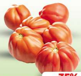
Fleischtomaten HKL siehe Etikett frisch, je kg