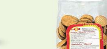
Mürbekekse "Münzen" 400g (1kg = 3,48*)