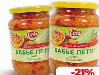
Gemüsesalat Babje Leto, Leis 720 ml (1kg = 3,16*)