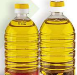
Sonnenblumenöl raffiniert oder nicht raffiniert 1 L