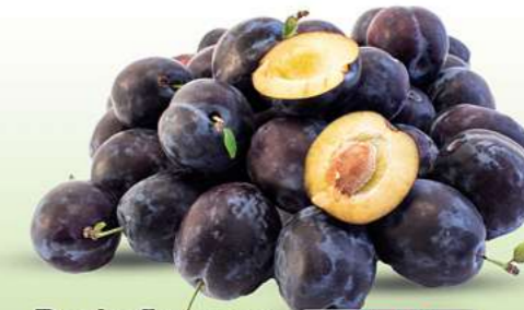
Backpflaumen Zwetschgen HKL und Herkunft siehe Etikett je kg