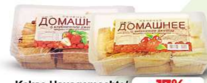
Kekse Hausgemachte "Domaschnee" verschiedene Sorten 350g (1 kg = 7,11*)