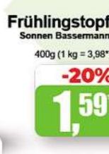
Frühlingstopf Sonnen Bassermann 400g (1 kg = 3,98*)