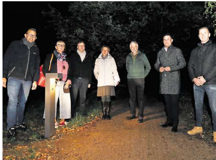
Es werde Licht: Vertreter der Stadt Gifhorn und der beauftragten Firmen nehmen die neue Beleuchtung am Schlosssee in Augenschein.

„Ich bin immer wieder gefragt worden, ob die Stadt denn nicht den Weg am Schlosssee beleuchten könnte“, berichtet Bürgermeister Matthias Nerlich. „Deshalb freue ich mich sehr darüber, dass wir rechtzeitig zu Beginn der dunklen Jahreszeit die Beleuchtung in Betrieb nehmen konnten.“ Jetzt könne man hier beispielsweise nach einer Abendveranstaltung im Mühlenmuseum am See entlanglaufen oder einfach mal einen Spaziergang machen und die tolle Atmosphäre mit dem erleuchteten Stadtpanorama genießen. „Das wertet das ganze Ensemble um Schlosssee