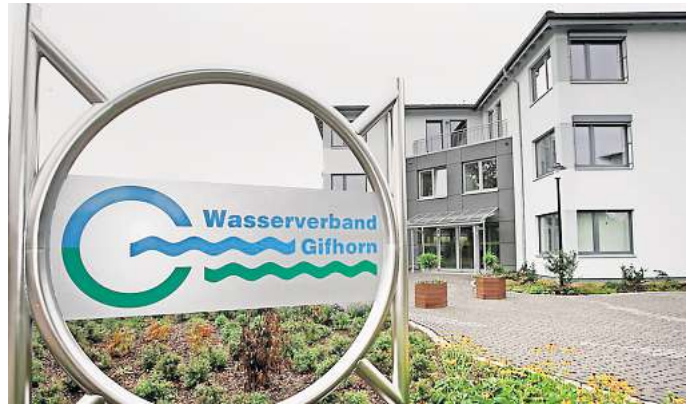
Wasserverband Gifhorn: Die Verbandsversammlung hat Investitionen in Höhe von 29 Millionen Euro beschlossen.

In der Samtgemeinde Wesendorf sollen circa 3,5 Millionen Euro aufgewendet werden, unter anderem für eine Erneuerung an der Kläranlage und Kanalsanierungen in Wesendorf sowie für das Baugebiet Böttelsfeld 2 in Groß Oesingen.