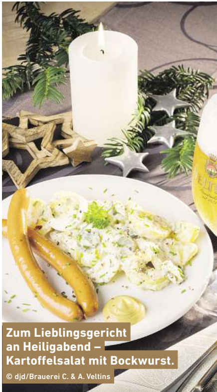
Zum Lieblingsgericht an Heiligabend – Kartoffelsalat mit Bockwurst.