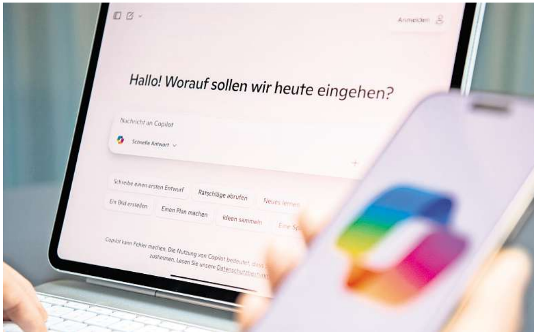
Ob zur Inspiration oder als Organisationshelfer: Wer Chatbots clever einsetzt, kann sich im Arbeitsalltag Erleichterung verschaffen.

KI Assistenten können jede Menge. Zum Beispiel: den Arbeitsalltag strukturieren,