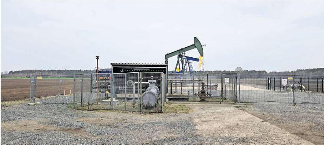
Vermilion Energy will in den kommenden Jahren mehrere Anlagen im Nordkreis umbauen oder erneuern.

Vermilion Energy will Anlagen im Gifhorne Nordkreis über mehrere Jahre hinweg erneuern