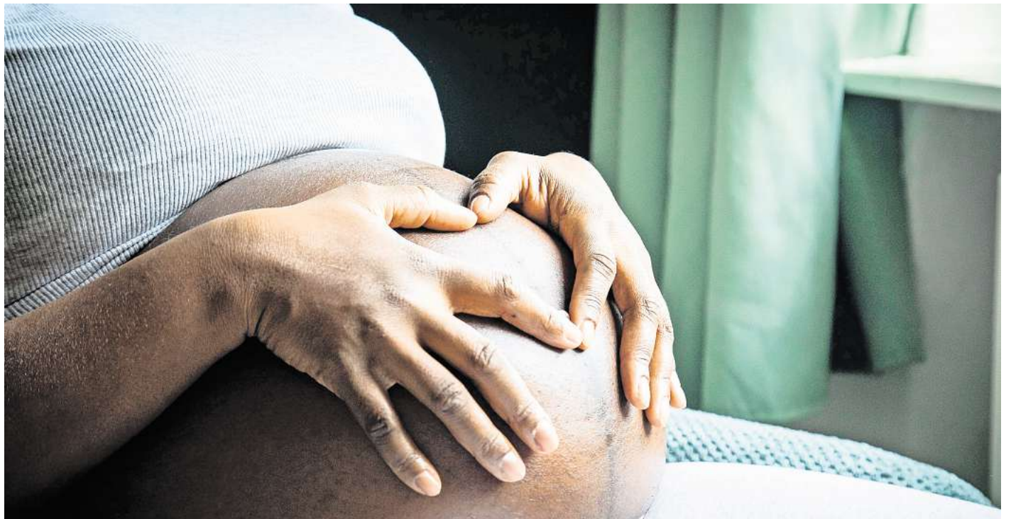
Gefühle zulassen: werdende Eltern können Enttäuschung empfinden, wenn das Geschlecht des Babys nicht dem Wunsch entspricht und sollten diese Gefühle nicht verdrängen.