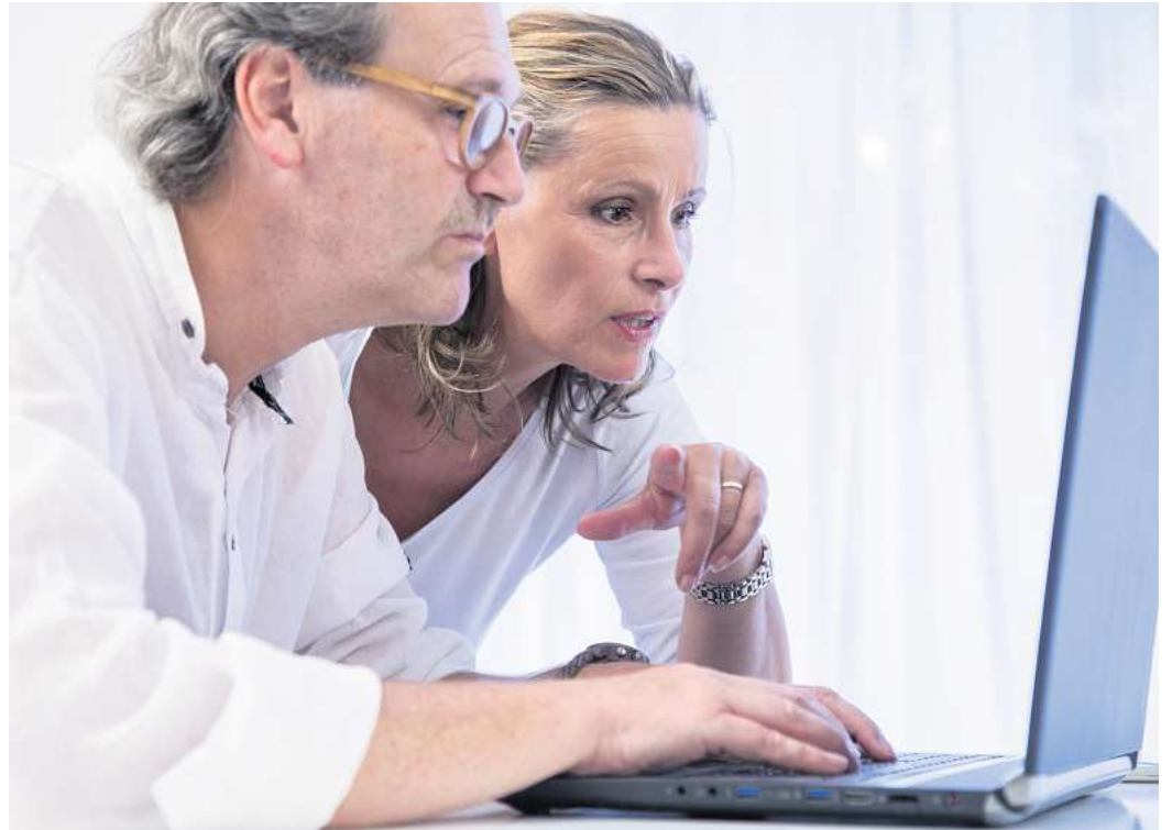
Vorsicht: Vertragsoptimierer werben im Netz und auf Social Media damit, die ungeliebte Lebens- oder Rentenversicherung lukrativ abzuwickeln.

Zum Hintergrund: Gegen manche kapitalbildende Lebens- und Rentenversicherungen können Versicherte Widerspruch einlegen und Verträge damit verlustfrei rückabwickeln. Das ist der Fall, wenn sie bei Vertragsschluss fehlerhaft oder unzureichend auf ihr Widerrufsrecht hingewiesen wurden. Die Anbieter im Netz erklären aber häufig jeden Vertrag für widerspruchsgerecht - und irren damit. (dpa)