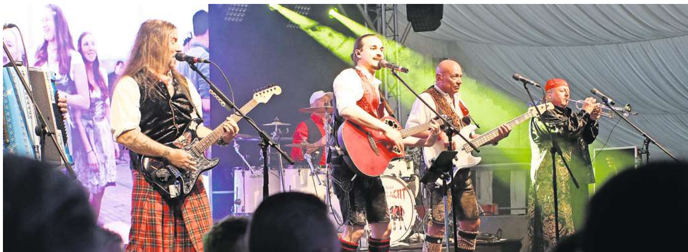
Die sechsten Frühlingswiesn in Isenbüttel: Die Münchner Zwietracht ist wieder mit dabei.