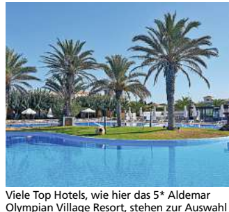
Viele Top Hotels, wie hier das 5* Aldemar Olympian Village Resort, stehen zur Auswahl

und Naxos sind wie auch die Flüge im Frühjahr/Sommer bereits vollständig ausgebucht. Den Katalog, weitere Informationen und Buchungsmöglichkeit dieser exklusiven Angebote unter www.fliegen-ab-braunschweig.de , im FIRST Reisebüro Schmidt und weiteren Reisebüros oder unter der kostenfreien (aus dem dt. Festnetz) Buchungshotline T. 08 00 / 38 300 38 (Mo.-Fr. 9-18, Sa. 9-13 Uhr).