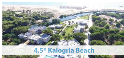
4,5* Kalogria Beach