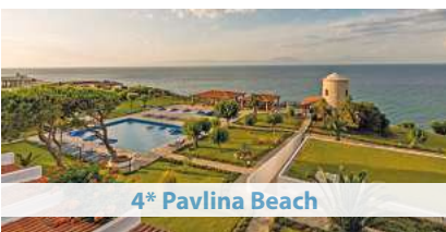
4* Pavlina Beach