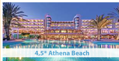
4,5* Athena Beach