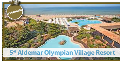
5* Aldemar Olympian Village Resort