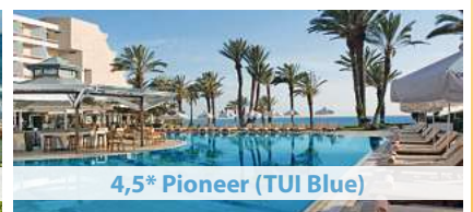
4,5* Pioneer (TUI Blue)