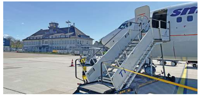
Fliegen ab Braunschweig! Exklusiv bei DER SCHMIDT / momento

Doch nicht nur die Peloponnes wird im Herbst ab Braunschweig angefliegen. Auch die südliche Insel Zypern lockt