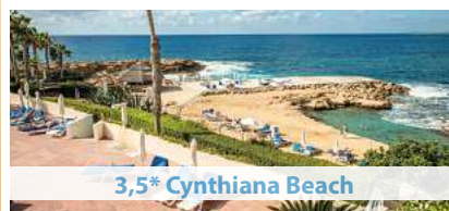
3,5* Cynthiana Beach